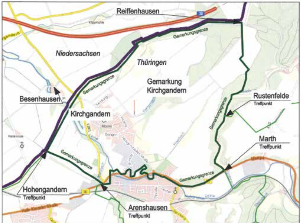
Grenzabgang der Gemarkung Kirchgandern am 28. Mai 2022