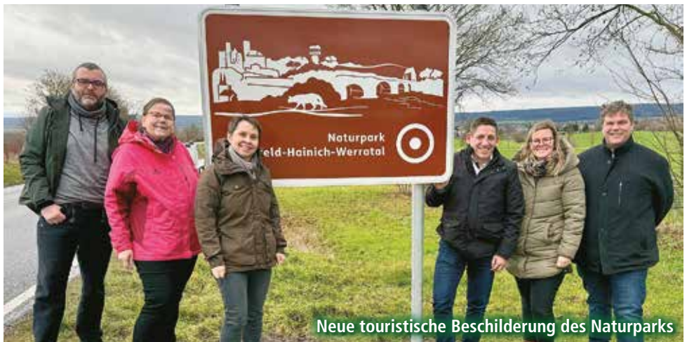
Neue touristische Beschilderung des Naturparks

Veranstalter: TSV REIFFENHAUSEN, Radfahrerverein MERKUR, Freiwillige Feuerwehr